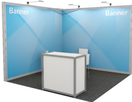
9 m 2 Beispiel