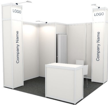
9 m 2 Beispiel