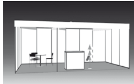
18 m 2 Doppel-Komplettstand 18 m 2 Double Booth