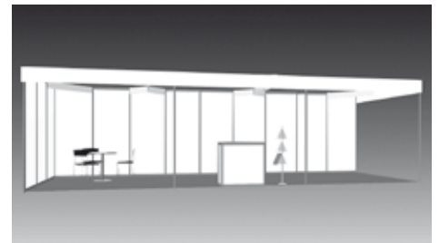
27 m 2 Dreier-Komplettstand 27 m 2 Triple Booth